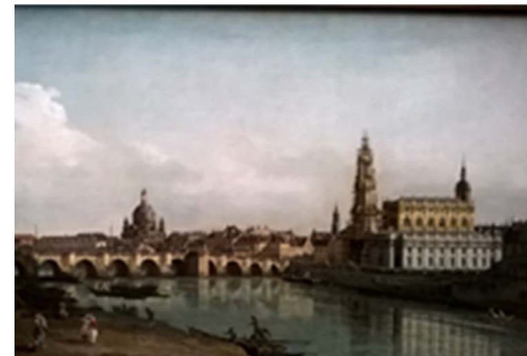
Titelbild: Canaletto: Dresden, Foto N. Schöps